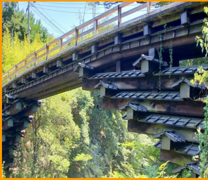
山梨県大月市 『猿橋』