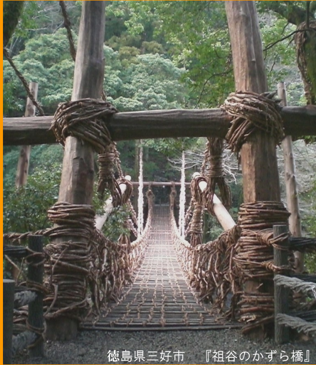
徳島県三好市 『祖谷のかずら橋』